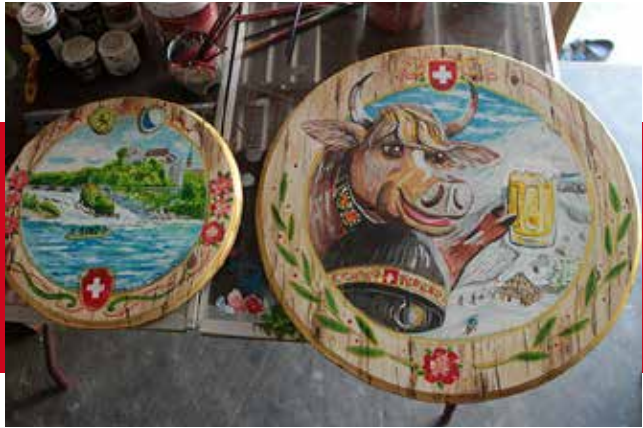
WC, Ein- und Ausgang Motive, Schaffhauser Rheinfall und die Chübeli Chue.