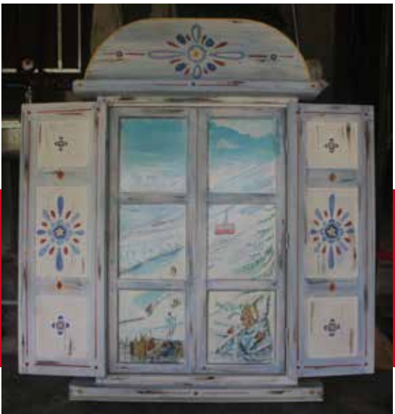
Klimaschalterabdeckung mit Fenster zum öffnen.